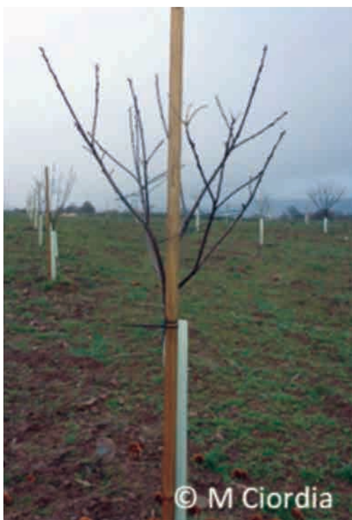
→ Foto 4.-Castaño juvenil podado en vaso.

La poda tipo vaso es el sistema de poda más frecuente en frutales. Se inicia cuando el diámetro del tallo alcanza unos 7 cm en su base, que se guía vertical, y generalmente ayudado de un tutor. Con la primera poda se despunta la planta a una altura de 2-2,5 metros. Las podas posteriores seleccionan tres ramas principales formando entre sí un ángulo de unos 120°, y eliminan las demás ramas que surjan del tallo principal. Sobre las tres ramas irán apareciendo otras de carácter secundario, sobre las que se repite el procedimiento, dejando las que sean más gruesas. Y así sucesivamente, de forma que al