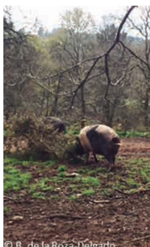
↓ ↘ Foto 1. -Porco Celta (izda.) y Gochu Asturcelta (dcha.) en extensivo.

Estas razas son morfológicamente muy parecidas. Tienen además en común la elevada rusticidad antes mencionada, que les permite ser explotadas al aire libre. Recuperar una raza autóctona carece de sentido si no se adopta de inmediato un sistema de explotación apropiado para ella. Si bien pueden ser alimentados con piensos compuestos elaborados según recomendaciones y requerimientos, la vocación del Porco Celta y Gochu Asturcelta (Foto 1 izda. y 1 dcha.) es claramente el aprovechar durante el verano los estratos arbustivo-subarbustivo y herbáceo de los bosques plano-caducifolios y los frutos (castañas, bellotas y hayucos) durante el otoño e invierno, aunque en función del momento del sacrificio pueden requerir suplementación final con castaña de destrío y/o aporte de pienso.