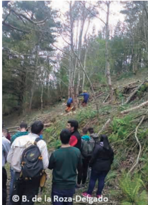
← Foto 3.-Jornada demostrativa de claras en el monte bajo de castaño de Sela da Loura (Vegadeo, Asturias), proyecto CASTACELTA.

Las recomendaciones existentes en Galicia y Asturias para el castaño se recogen en la Orden del DOG nº 106 de 2014/6/5 de la Xunta de Galicia y en el Catálogo de Modelos Selvícolas del Principado de Asturias (2015).