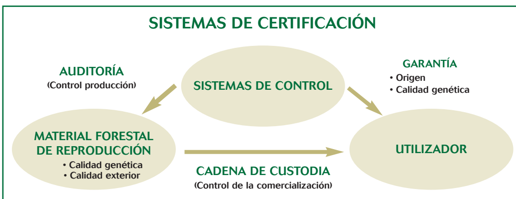
Figura.- Sistema de certificación de materiales forestales de reproducción.

Este Real Decreto se aplicará a la producción con vistas a la comercialización y a la comercialización de los materiales forestales de reproducción de las especies forestales y de sus híbridos artificiales que figuran en la tabla 1.